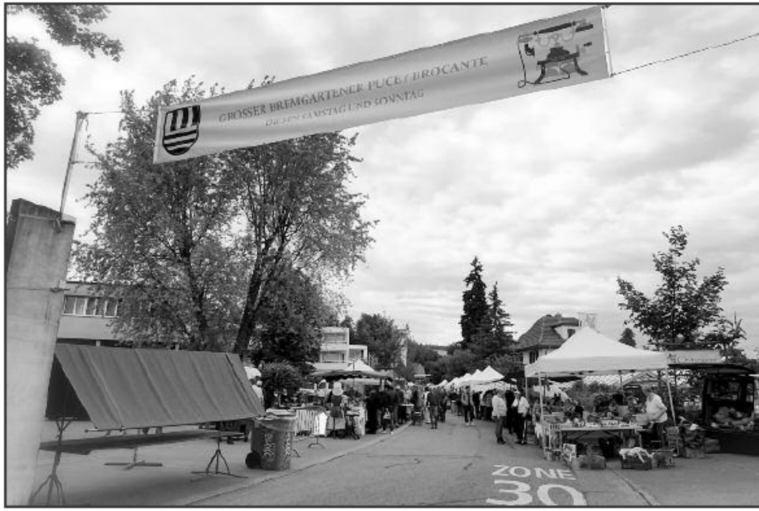
Wird das Puce-Banner wirklich nur noch ein Mal aufgehängt?